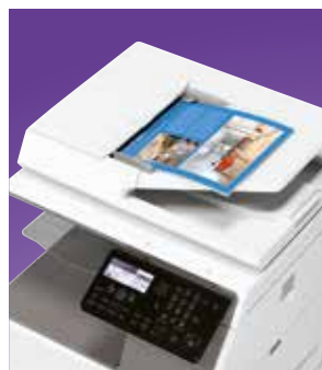
Barevné skenování po síti